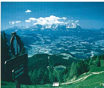
『キットピュールの夏』 工藤 真一 (環境新聞社)