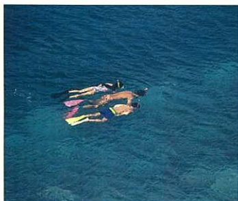
『海中探索』 勝又 時彦 (東京交通新聞社)