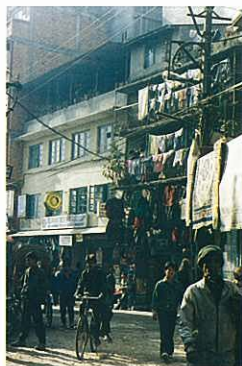
『朝の空気 (ネパールカトマンド)』 上田ひろみ (日本教育新聞社)