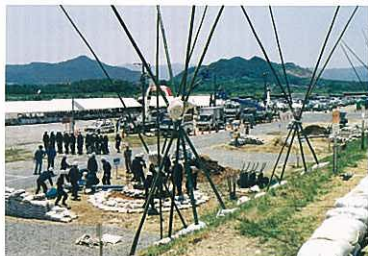
『水防訓練』 平岡 繁彦 (建通新聞社)