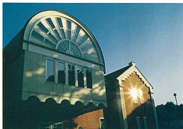
『95横浜 夏の終わりに』 馬場 孝仁 (ポスティコーポレーション)