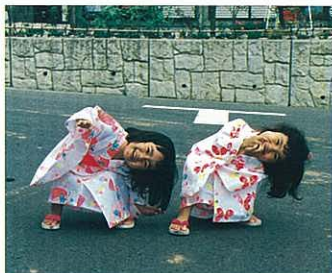
『はやくおまつりこないかにやあ』 黒田 秀男 (物流ニッポン新聞社)