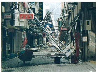
『三宮駅近くの商店街』 宮坂 博明 (日本金座理髪社)