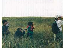
『阿武隈の一日』(縮写真) 田丸 瑞穂 (日本経営新聞社)