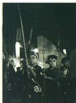
『子供祭りの一日』 (組写真) 森田 富士夫 (日本流通新聞社)