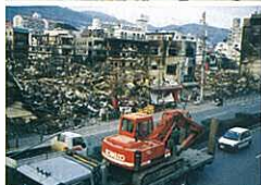
『阪神大震災と物流』(縮写真) 松見 浩希 (物流ニッポン新聞社)