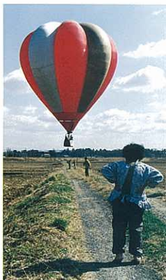
『熱気球 着地寸前』 笠井 忠宏 (日本工業経済新聞社)