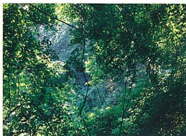
『樹海』 藤木 雅巳 (日本教育新聞社)