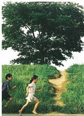
『裸足の夏休み』 田畑 冬樹 (金融タイムス社)