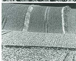
『キャベツ畑の印象』(組写真) 笠井 忠宏(日本工業経済新聞社)