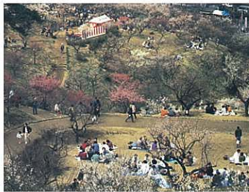
『梅まつり(青梅の梅園)』 蓮見 静子 (日本教育新聞社)