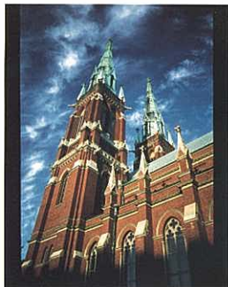
『白夜の尖塔—ヘルシンキフィンランド』 工藤 真一(環境新聞社)