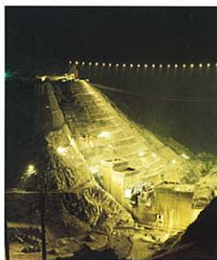
『あかり』 高羅 満也 (中建日報社)