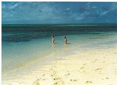
『海辺』 西條 早苗 (セメント新聞社)