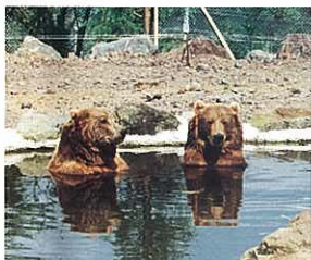
『熊の避暑』 塩田 英雄 (ボスティコーポレーション)