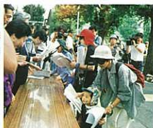
『ボクの社会参加オゾン 層保護を呼びかける こともと大人の国会 パレード』(組写真) 磯尾 緑(日本教育新聞社)