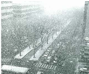
『1996 仙台・雪』