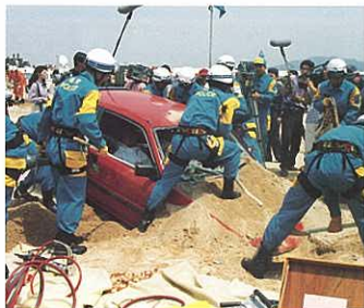
『緊急事態発生ノ埋設車両を 救助せよ—福岡県防災訓練』 荒川 重幸(物流—アポ—新聞社)