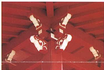
『現代に生きる斗供組』 伊藤 邦彦(建設新聞社)