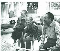
『すずむ高齢化— 老人デイサービスセン ターで』(組写真) 大高 智子(読売新聞社)