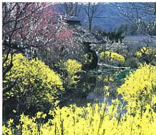
『伊那の梅苑』 浅野 烈 (日本教育新聞社)