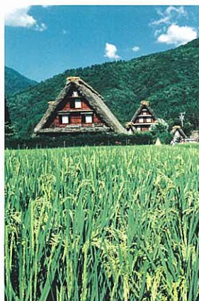
『ふるさとの夏』 草間 章宏 (新農林社)