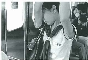
『東京通勤録』(組写真) 十文字 義之 (日本流通新聞社)