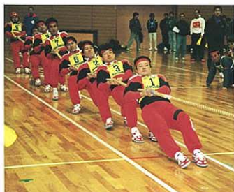
『ヤマト運輸東北支社の 綱引き大会』 黒田 秀男 (物流ニッポン新聞社仙台支店)